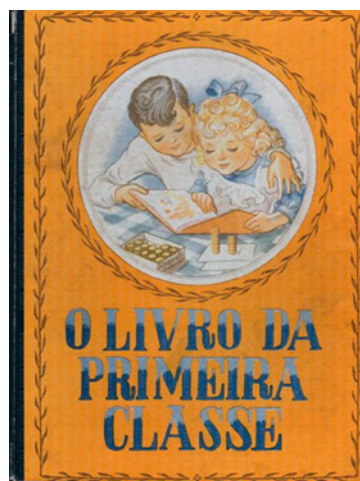
Figura 2. Livro de Leitura da 2.ª classe, 1.ª ed., 1944