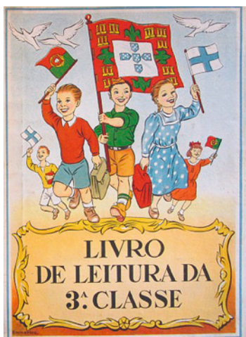
Figura 3. Livro de Leitura da 3.ª classe , 1.ª ed., 1958