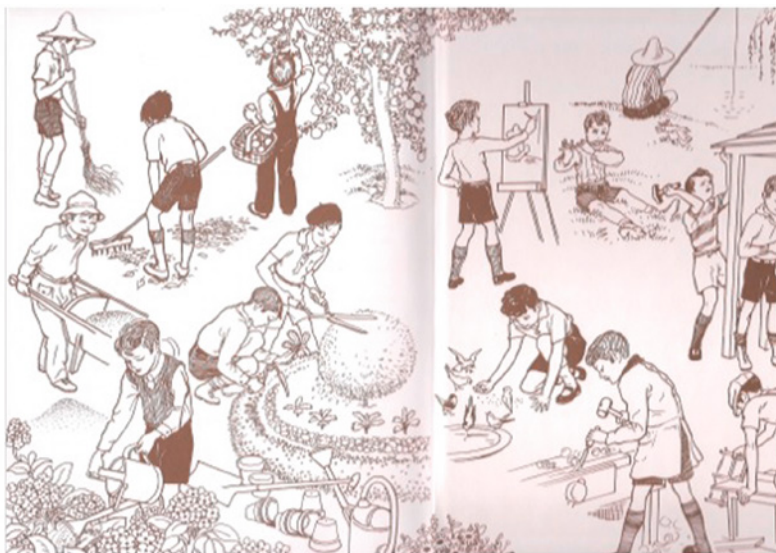
Figura 6. Guardas do Livro de Leitura da Primeira Classe , 1. a ed. 1941

dizia uma delas naquela tarde: — O leite-creme é o doce de que eu mais gosto. Até já aprendi a fazê-lo». 62