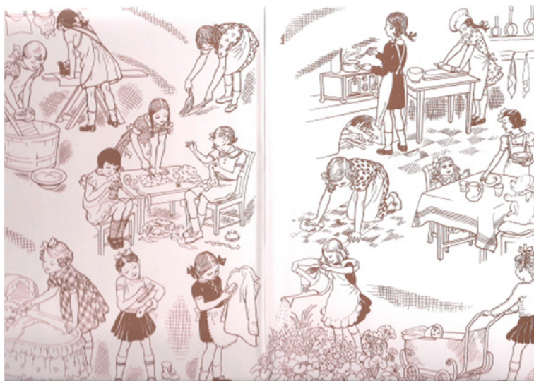
Figura 7. Guardas do Livro de Leitura da Primeira Classe , 1. a ed. 1941.